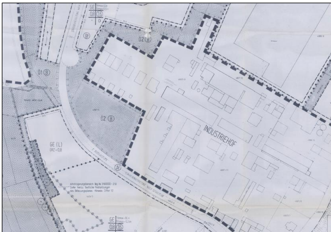
Abbildung 8: Auszug aus dem B-Plan "13S Schlangenwühl" (STADTVERWALTUNG SPEYER 1998A)

Umliegend des Geltungsbereichs befindet sich der rechtskräftige Bebauungsplan „13s Schlangenwühl Süd“ (siehe Abbildung 8), welcher durch den vorliegenden Geltungsbereich in Richtung Westen und Süden bereichsweise überplant wird.