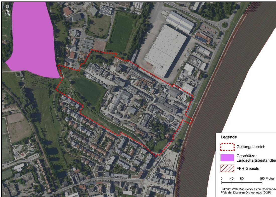
Abbildung 6: Geschützter Landschaftsbestandteil und FFH-Gebiete im Geltungsbereich (NV RLP 2024)