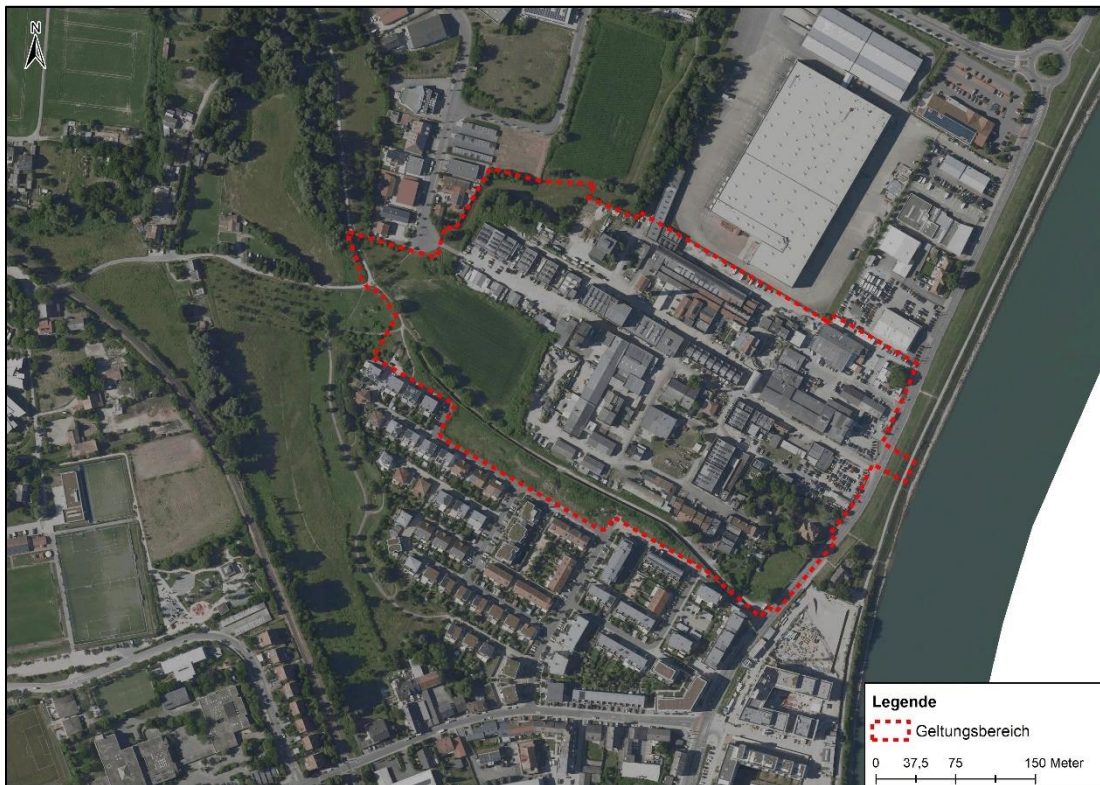
Abbildung 3: Darstellung des Geltungsbereichs und des umgebenden Plangebiets

Die Umgebung des Plangebiets ist unterschiedlich strukturiert. Im Norden grenzt durch ein ehemaliges Logistikzentrum ebenfalls eine gewerbliche Nutzung an. Die verkehrliche Anbindung erfolgt über die östlich gelegene und entlang des Geltungsbereichs verlaufende Franz-Kirrmeier-Straße. Daran schließt sich in östlicher Richtung der Rhein einschließlich des Damms an. Im Süden befinden sich Wohnnutzungen, vorwiegend aus einer offen strukturierte Einzelbebauung mit Hausgärten, die durch einen bewachsenen Wall mit anschließender Mauer (ehemalige Betriebseinfriedung der Firma Dupré) vom Geltungsbereich räumlich getrennt sind. Nach Westen hin gestaltet sich die Landschaft offener. Hier schließen sich Grünlandbrachen mit Baumbeständen an, umgeben von Feldgehölzen und Gebüschstreifen.