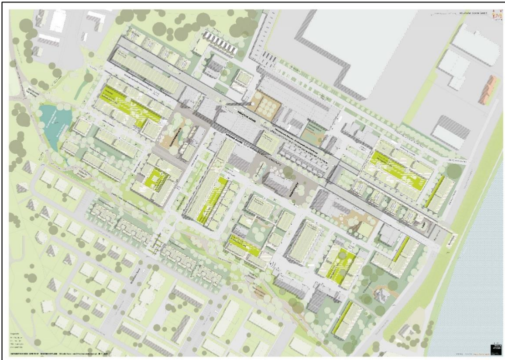
Abbildung 1: Rahmenplan (HILLE TESCH ARCHITEKTEN + STADTPLANER PARTGMBB, BIERBAUM.AICHELE.LANDSCHAFTSARCHITEKTEN PARTGMBB 2023)

Als Grundlage für das Bebauungsplanverfahren wurde im Zuge eines städtebaulichen Wettbewerbs ein Rahmenplan aufgestellt, der die städtebauliche Entwicklung des Areals darstellt.