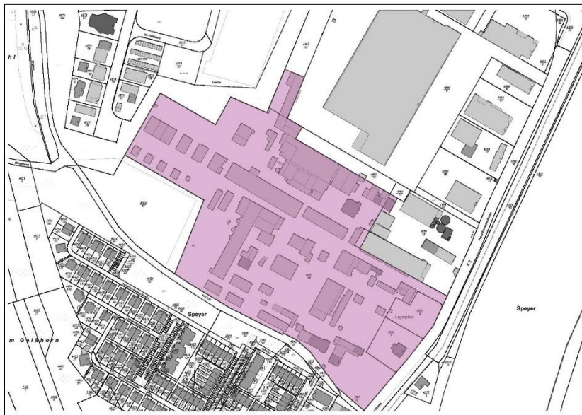
Abbildung 9: Kulturdenkmale im Geltungsbereich (GDKE 2021B)

Im Plangebiet sind zwei Kulturdenkmale gemäß § 2 DSchG vorhanden. Die ehemalige Celluloidfabrik Kirmeyer & Scherer ist als bauliche Gesamtanlage geschützt. Dazu gehören Eisenbeton- und Backsteinbauten, u.a. mit der Wäscherei (Holländerhaus), der Neuen Nitrierung und der Direktorenvilla, die aus den Jahren 1897-1969 stammen. Die Direktorenvilla liegt im Südosten des Geltungsbereichs und steht zusätzlich als Einzeldenkmal unter Schutz (GDKE 2021A) (siehe Abbildung 9). Aufgrund des guten Erhaltungszustands und der lokalen bis regionalen Bedeutung des Kulturguts wird von einer mittleren (2) Bedeutung ausgegangen.