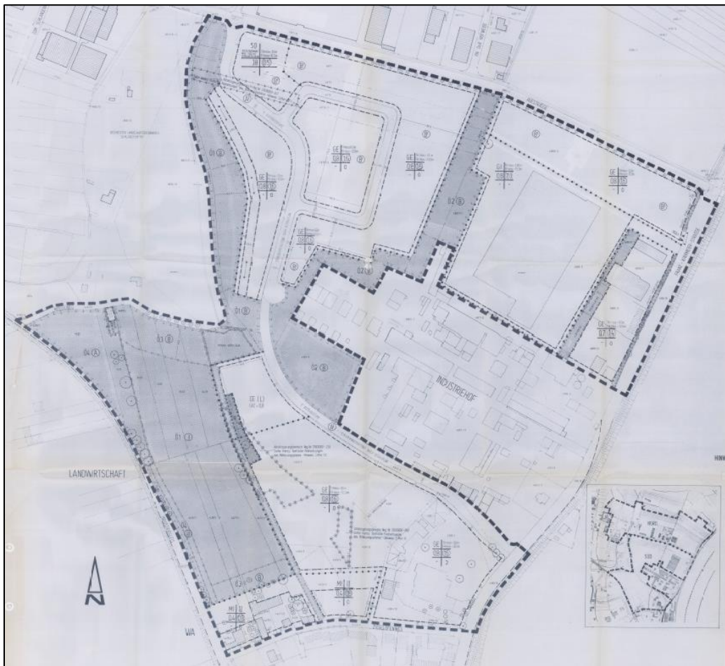
Abbildung 5: Geltungsbereich des B-Plans 013S (STADTVERWALTUNG SPEYER 1998A)

Umliegend der vorliegenden Planung grenzt der B-Plan Nr. 013S „Schlangenwühl Süd – Teilbebauungsplan“ der Stadt Speyer an. Aufgrund der Vergrößerung des Geltungsbereichs des Industriehofs in Richtung Westen und Süden wird der B-Plan 013S bereichsweise überplant. Im Westen befinden sich Kompensationsmaßnahmen (vgl. Kap. 0), im Süden eine geplante Straße, die sich bis zum Wendehammer der Hasenpfühlerweide erstreckt sowie ein daran anschließendes festgesetztes Gewerbegebiet (STADTVERWALTUNG SPEYER 1998A).