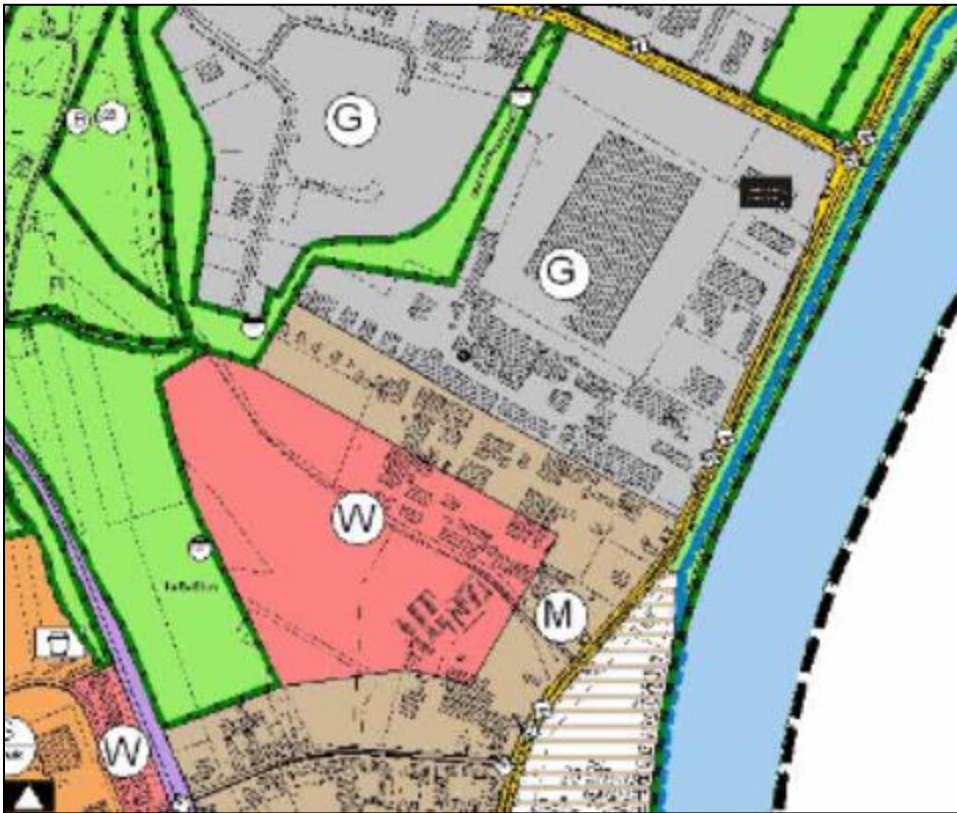
Abbildung 4: Auszug aus dem Flächennutzungsplan (STADTVERWALTUNG SPEYER 2008)

Ein Teilbereich des Geltungsbereichs ist weiterhin als mittelfristiges Wohnbaupotenzial (W) definiert.